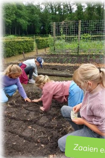
Zaaien en planten!