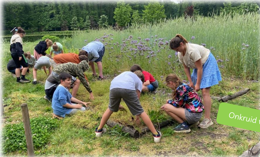
Onkruid wieden en winterkoren verwijderen.

Wandel tijdens ons tuinfeest zeker eens langs de moestuin om dit prachtig stukje natuur te bewonderen. Onze kinderen (en wijzelf stiekem ook) zijn er trots op.