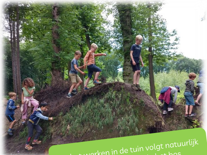
Na het werken in de tuin volgt natuurlijk ook de ontspanning in het bos.