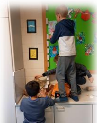
een eigen knikkerbaan