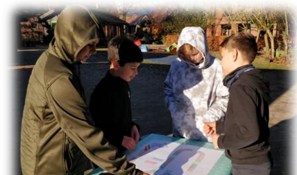
We leren buiten.